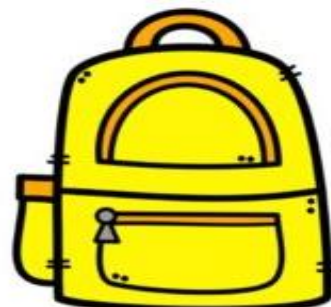
MOCHILA 25 REAIS

2. COM BASE NAS INFORMAÇÕES ACIMA, RESPONDA: