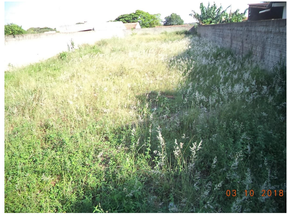
AGENTE FISCAL: Marcio/Wilians em 03/10/2018

OBSERVAÇÕES: Não sendo possível localizar o infrator para recolher sua assinatura. Segue o Auto de Infração assinado por duas testemunhas capazes conforme § 2º Art. 17 e 18 da Lei Municipal 2.749/2006.