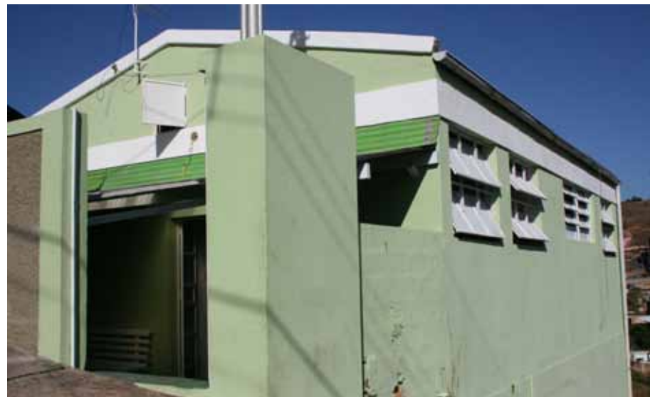
O posto do Nova Esperança fica localizado na rua 1, nº 120