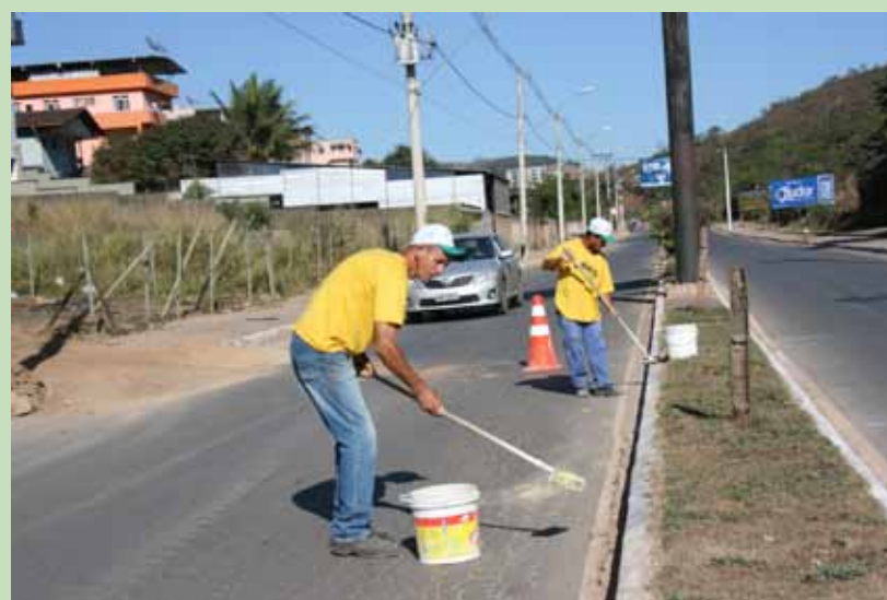
Caiação de meios-fios na avenida Gentil Bicalho