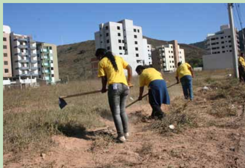
Limpeza no bairro JK

Equipes do Programa Passando a Limpo iniciaram a limpeza nas avenidas Castelo Branco, no bairro República e Gentil Bicalho, no JK. O bairro Tanquinho, parte do Lucília e a avenida Issac Casseiro, no Loanda, também receberam limpeza e caiação de meios-fios em alguns pontos.